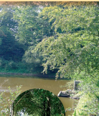
Étang de la Corbonnais

Construite en 1872, c'était à l'origine une école de filles tenue par 3 religieuses. Après les lois Jules Ferry et Combes qui excluent les religieuses de l'enseignement, l'école est devenue laïque. Cette ancienne école appartient à la commune.