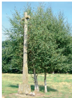
La Croix du Coucou

est une croix de mission, érigée en 1884 lors d'une campagne d'évangélisation. Ces missions ont existé jusqu'en 1955 à Épiniac. Elles avaient lieu tous les 5 ans et se terminaient ordinairement par l'établissement d'une croix, souvent érigée par des notables qui faisaient graver leur nom sur le socle.